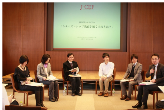
▲ショートスピーチの様子