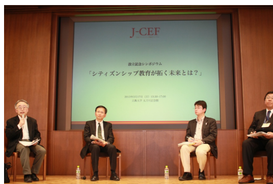
▲パネルディスカッションの様子